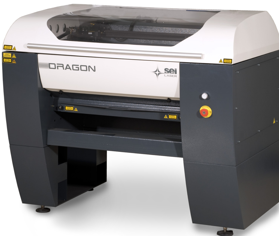
Gruppo ottico/focali intercambiabili