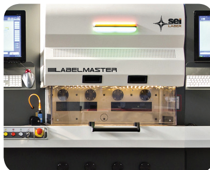
Stazione di fustellatura laser