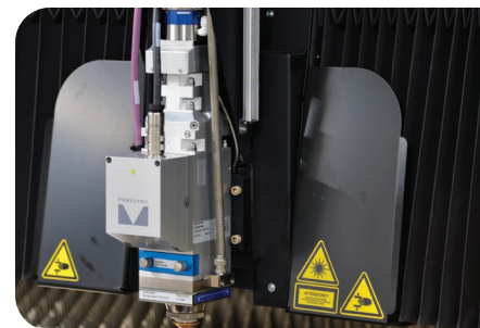
Tête de découpe avec focale optique motorisée