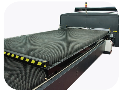
Tables mobiles pour chargement/déchargement